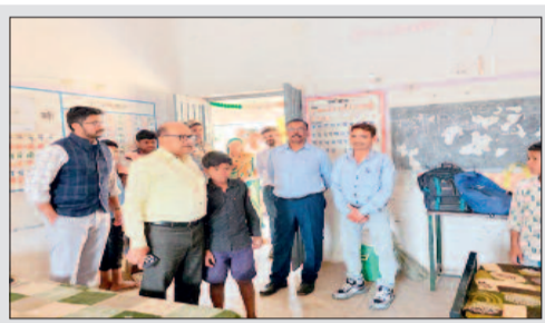
प्रतिदिन की प्रगति रिपोर्ट भेजें

इस जल प्रदाय योजना की कुल लागत 7 करोड़ 78 लाख रुपये है। योजना पूर्ण होने पर सुपेबेड़ा और आसपास के 09 गांवों के ग्रामीणों को स्वच्छ, शुद्ध तथा पर्याप्त मात्रा में पेयजल की उपलब्धता सुनिश्चित होगी,